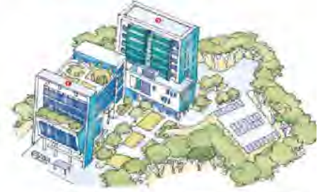
1. 경북대학교 치과병원 2. 치과대학-치의학전문대학원